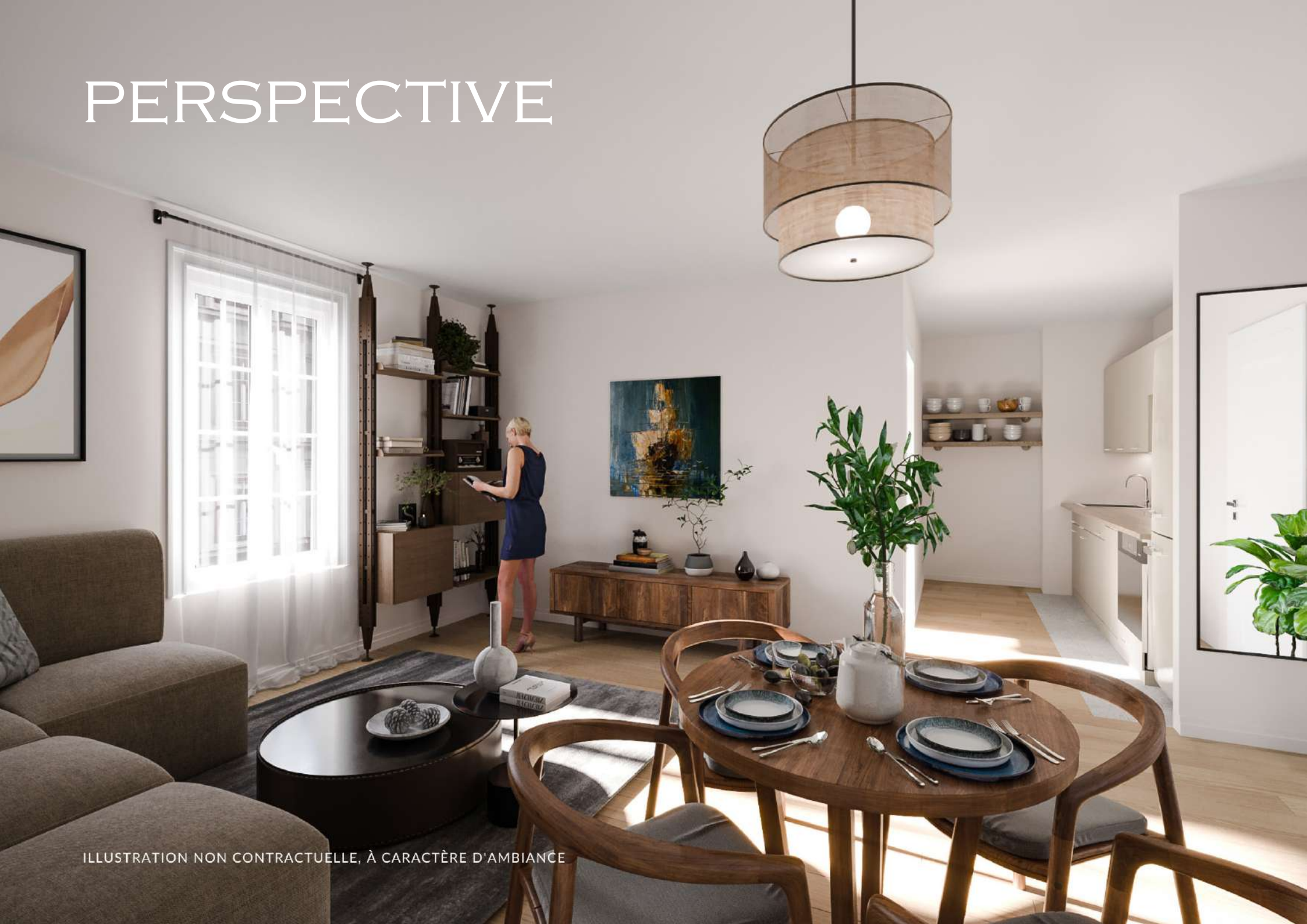
ILLUSTRATION NON CONTRACTUELLE, À CARACTÈRE D'AMBIANCE